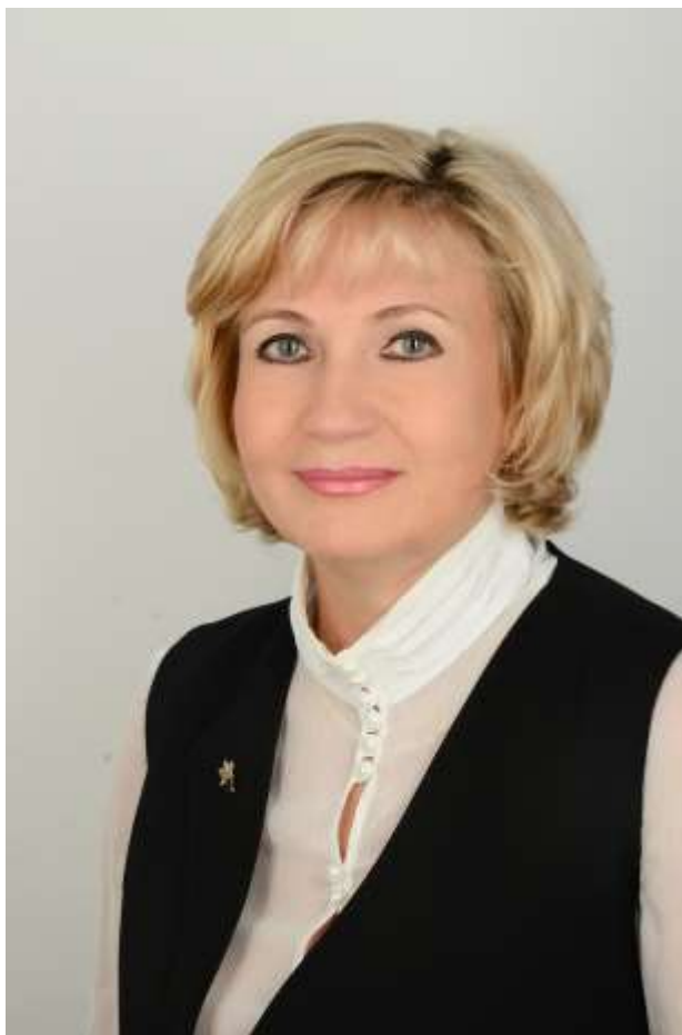
Учитель музыки, педагог дополнительного образования МБОУ НШ «Прогимназия»

«Интеграция основного и дополнительного музыкального образования как фактор творческого развития ребенка в прогимназии»